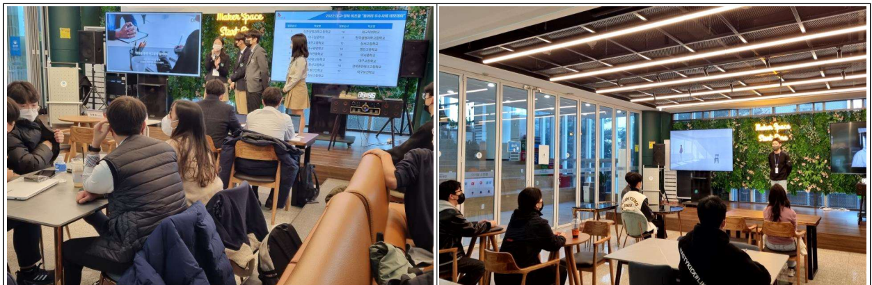
[대구테크노파크 데모데이 행사]