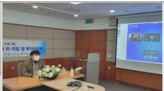
[대구테크노파크 온라인 IR센터 행사]